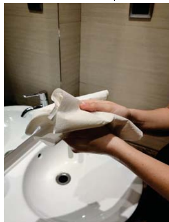
Sécate con una toalla desechable,