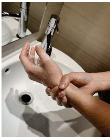
y continua lavando las muñecas.