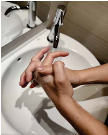
las palmas entre sí, con los dedos entrelazados,