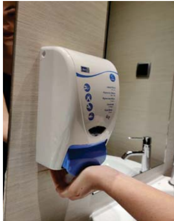
Deposita suficiente jabón en las palmas.