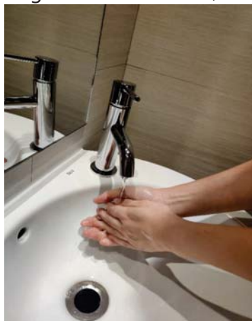
Enjuágate las manos.