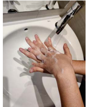
la palma de una mano contra el dorso de la otra, entrelazando los dedos y viceversa,