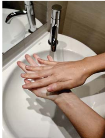
Frota las palmas entre sí,