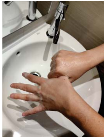
el pulgar con la palma de la mano, rotando,