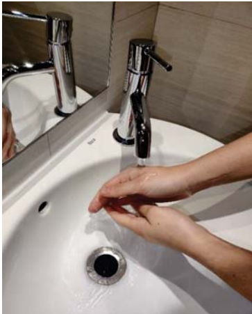
Mójate las manos.